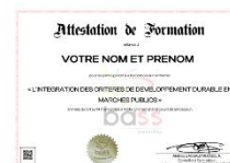
Attestation de fin