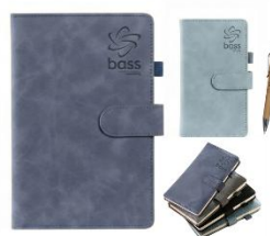
Bloc Notes A4 / A6 et Stylo