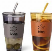
Gobelet en verre pour thé