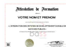
Attestation de fin