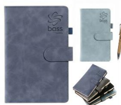
Bloc Notes A4 / A6 et Stylo