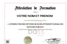
Attestation de fin