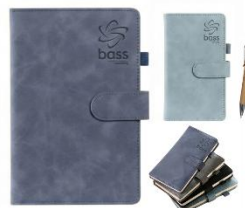
Bloc Notes A4 / A6 et Stylo