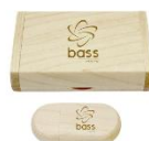
Clé USB avec documentation