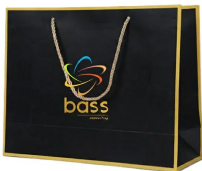
Sac pour BASS Box