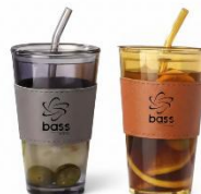
Gobelet en verre pour thé